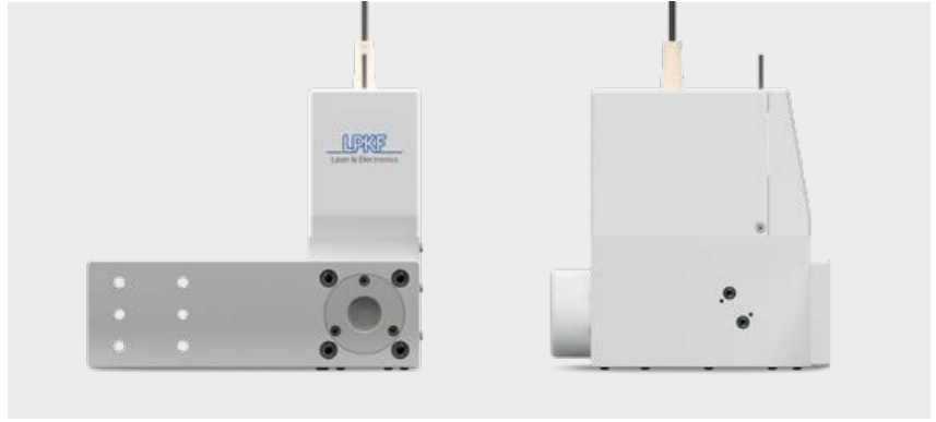
灵活适配的机械接口