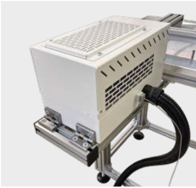
可选项：外置风冷激光柜设备布局灵活性更强

该系统可以配备不同的风冷激光器，这使得 RadialWeld 2000 非常节能和环保。还有一种选择，风冷激光器也可以安装在单独的机柜中。